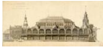
Fonds Chambon (1_CHAMB)