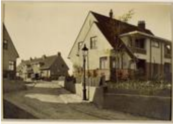
Fonds Bodson (1_BODSO)