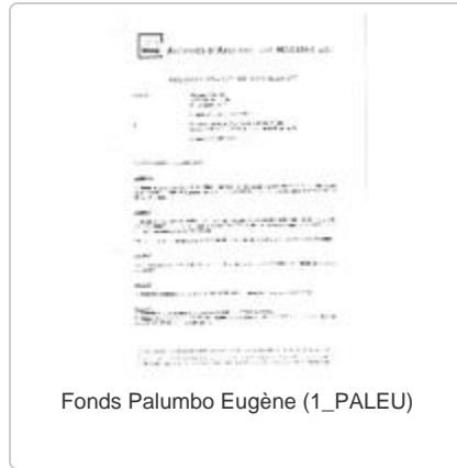
Fonds Palumbo Eugène (1_PALEU)

Projet C.A.P.S.A. Village n°1, Reine Fabiola (1_PECRE-Pap-NUM-598)