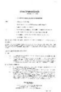
Fonds Vandervoort Pierre (1_VANDPI)