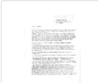
Fonds Dhucque Eugène (1_DHUEU)