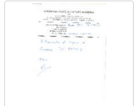
Fonds Van de Velde Henry (1_VANHE)