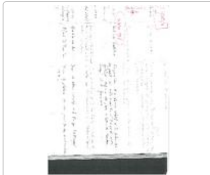
Fonds Hankar Paul (1_HANPA)

Projet de planches de jardins pour la maison d'éditions SOPEL (1_PECRE-Pap-NUM-536)