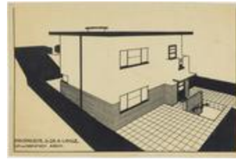
Fonds De Koninck (1_DEKON)