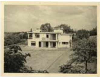
Fonds Duesberg Albert-Charles (1_DUEAC)