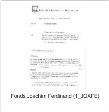
Fonds Joachim Ferdinand (1_JOAFE)