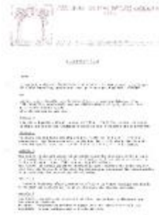
Fonds Van Nueten (1_VNUET)