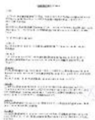
Fonds Dolphyn Jacques (1_DOLJA)